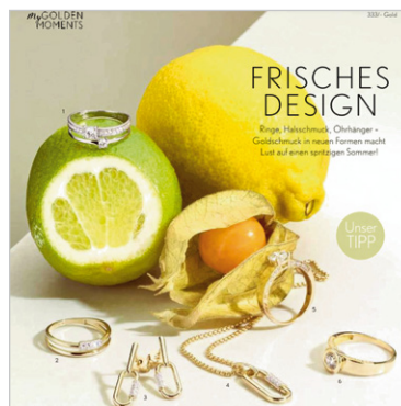
Frische, Sommer, Kauflaune

tag, 15. Juni 2024, 10:00 bis 19:00 Uhr ■ Sonntag, 16. Juni 2024, 10:00 bis 15:00 Uhr ■ Montag, 17. Juni 2024, 8:00 bis 17:00 Uhr. An diesen Tagen lädt der Vollsortimenter für den Uhren & Schmuck-Fachhandel wieder zur Hausmesse ein. Von Uhren- und Schmuck-Basics bis hin zu Trend-Kollektionen, Uhren 'Made in Germany' sowie Möbeln und Maschinen für die Werkstatt ist alles abgedeckt. Auf nach Münster: Bringen Sie Frische in Ihr Sortiment und stellen Sie sich bestmöglich für die neue Saison auf.