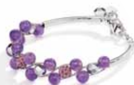
Armbänder mit Edelsteinen und Swarovski-Kristallen von Coeur de Lion. www.coeur.de