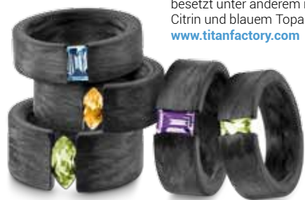
Ringe aus Carbon von Titanfactory, besetzt unter anderem mit Amethyst, Citrin und blauem Topas. www.titanfactory.com