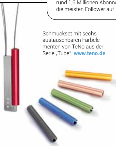
Schmuckset mit sechs austauschbaren Farbelementen von TeNo aus der Serie „Tube“. www.teno.de