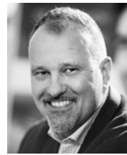
RÜSIGER WILP MARKENVERANT- WORTLICHER ADORA

Die Firma Carl Engelkemper Münster punktet nicht nur mit einem zeitgemäßen Sortiment, das aktuelle Trends aufgreift, sondern auch mit umfassender Unterstützung des Fachhandels. Neben Material für den P.O.S., Flyern und Katalogen und dem B-to-C-Onlineshop myTrends stellt das Haus Material für Facebook und Instagram bereit, um seine Kunden bestmöglich zu begleiten.