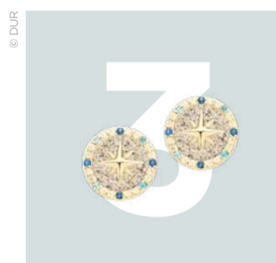
Ohrstecker Kompassrose, Sterling-silber, farbige Zirkonia | 159 Euro.