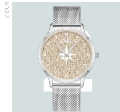
Strandzeit Kompass, Edelstahluhr 40 mm | 269 Euro.