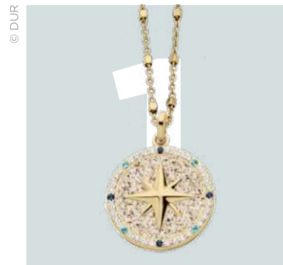
Anhänger Kompassrose, Sterling-silber, Strandsand | 179 Euro.

hinzuweisen – denn nur so wird der Kunde darauf aufmerksam. Vergoldeter Schmuck und Goldtöne liegen derzeit voll im Trend, bemerkt man auch bei DUR. In Sachen Marketing gibt es die beliebten Klassiker (Flyer, Broschüren, Schaufensterverklebungen, etc) – besonderes Highlight ist die Einführung regionaler Werbekampagnen auf Instagram und Facebook, bei denen bis zu 90.000 Personen für 150 Euro erreicht werden können.