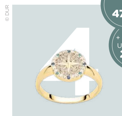
Ring Kompassrose, Sterlingsilber, Strandsand, Zirkonia | ab 159 Euro.

1+3+4 = 479,- + passende Uhr für ihn 269,-